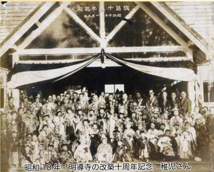
昭和10年「明導寺の改築十周年記念」稚児さん