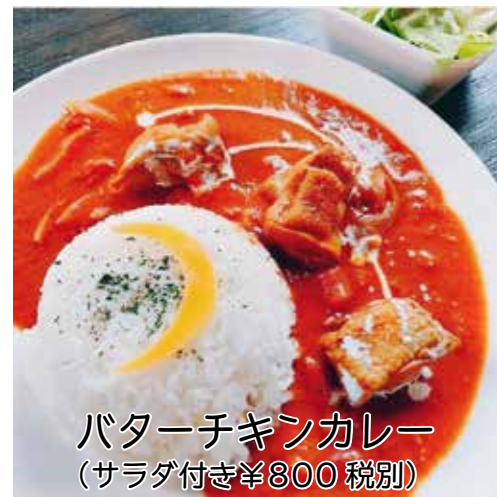
バターチキンカレー (サラダ付き¥800 税別)