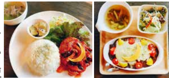
写真左：トマト煮込みハンバーグ 写真右：焼きカレー

平日限定のランチメニューとして、月替わりで三日月メニューを提供されているユノカフェさん。10月は焼きカレー、11月はトマト煮込みハンバーグ。そして今月12月はトマトを煮込み、スパイス香るバターチキンカレーです。年内は12月28日までの営業となりますので、召し上がりたい方はお早めに。そして来年1月4日から営業を開始されますが、1月のメニューはデミグラスソースが決め手の”ドレス・ド・オムライス”を予定しているそうです。どんなオムライスが出てくるか、想像するだけで楽しみです。